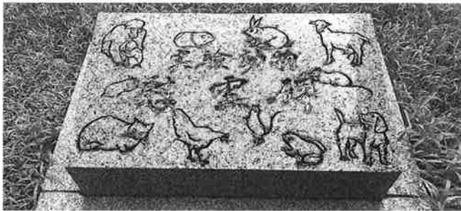
図 実験動物慰霊碑

問 6 下線部①に関連して、次の図と文章は、ある大学病院に置かれた石碑の写真と、それをめぐるPとQの会話である。66 ページの会話も踏まえて、文章中の a ・ b に入る記述の組合せとして正しいものを、下の①～④のうちから一つ選べ。 30