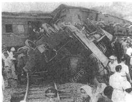
Y 福島県(東北本線松川駅付近)